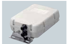
AH-4 COUPLEUR AUTOMATIQUE D'ANTENNE Couverture 3,5-30 MHz avec une antenne de 7 m ou plus.