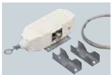
MN-100L COUPLEUR PASSIF Coupleur passif pour antenne long fil. 15m