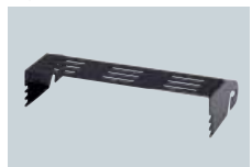
MB-5 BERCEAU Pour installation dans un véhicule, etc.