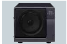
SP-21 HP EXTERNE Impédance : 8Ω Puissance Max. : 5W SP-20 HP EXTERNE toujours disponible