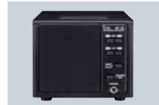
SP-23 HP EXTERNE 4 filtres audio et sortie jack. Impédance : 8Ω Puissance Max. : 5W