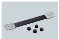
MB-23 POIGNEE DE TRANSPORT Pour un transport plus facile