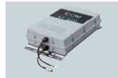
AT-140 ACCORDEUR AUTOMATIQUE D'ANTENNE HF Couverture 1,6-30MHz avec antenne de 7 m ou plus.