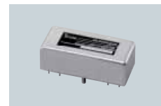
455 kHz FILTRES Facteur de forme permettant d'avoir une meilleure réception.