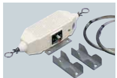
MN-100 COUPLEUR PASSIF Coupleur passif pour antenne dipôle. 2x8m