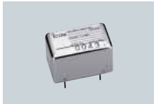
CR-338 CRISTAL HAUTE STABILITE Circuit de compensation de température pour avoir une meilleure stabilité en fréquence. Stabilité en fréquence : ±0,5 ppm