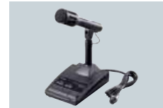
SM-20 MICROPHONE DE TABLE Fonctions [UP]/[DOWN] avec filtre passe haut