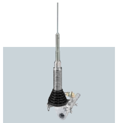
AH-2b ANTENNE Pour utilisation mobile avec AT-140 ou AT-130/E. Toutes bandes de 7-30MHz.