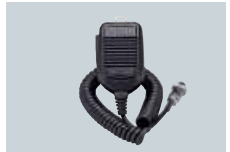
HM-36 MICROPHONE A MAIN