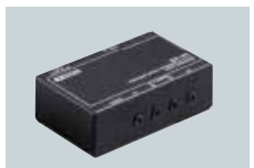
CT-17 CONVERTISSEUR DE NIVEAU CI-V Convertisseur de niveau CI-V pour transceivers connectables sur PC avec le port RS-232C.