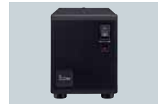
PS-125 ALIMENTATION A DECOUPE Alimentation puissante et compacte Sortie : 13,8 V DC (25 A max.)