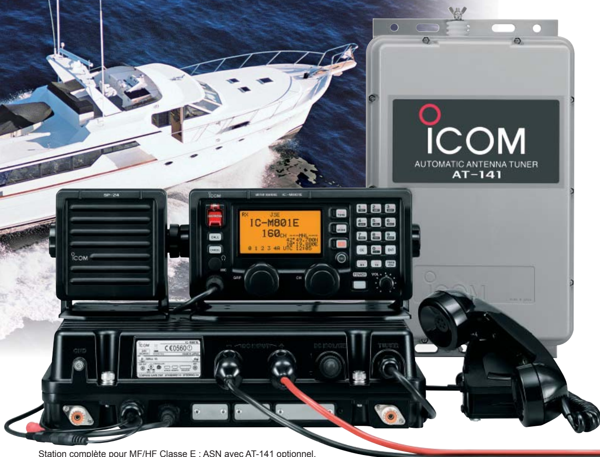
Station complète pour MF/HF Classe E ; ASN avec AT-141 optionnel.

Emetteur-récepteur BLU MF & HF ASN Classe E !