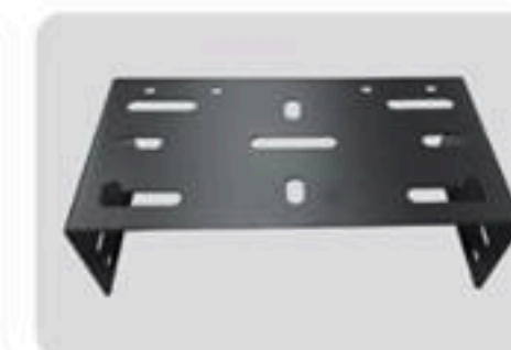
移动式安装支架 Mounting bracket