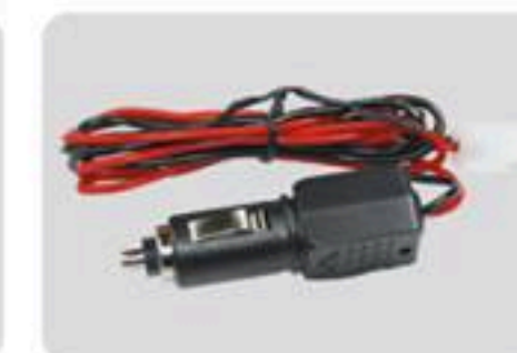
点烟头电源线 Cigarette butts power cord